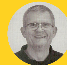
Monsieur D. Infirmier

et bien d'autres acteurs pour vous accueillir et vous accompagner (professionnels de santé, collectivités, services, acteurs de terrain...).