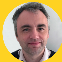
Docteur G. Médecin

" J'ai choisi il y a une dizaine d'années de m'installer dans le Tarn attiré par la gentillesse de ses habitants (j'ai épousé une Tarnaise). La ville d'Albi est à taille humaine et les conditions sont idéales pour que notre grande famille s'épanouisse dans la joie et la bonne humeur. Mes conditions de travail sont également très favorables : maillage de correspondants, possibilité de travail en équipe, accueil des étudiants, organisation de la permanence des soins. Venez dans le Tarn ! "