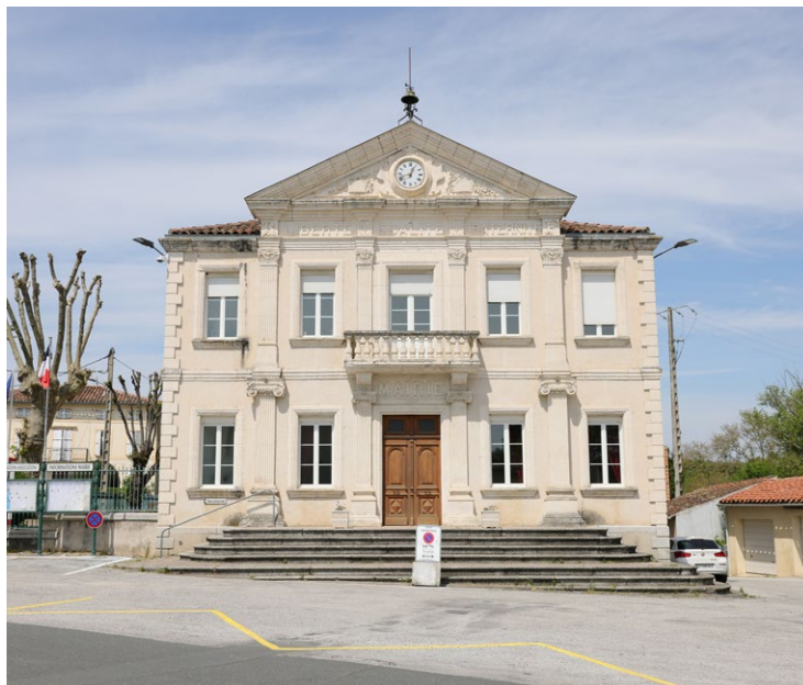
© Département du Tarn - Commune de Sémalens