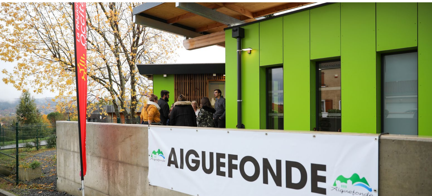
© Département du Tarn - École d'Aiguefonde

Le Département investit aux côtés des communes pour l'amélioration des conditions d'éducation et d'accueil de nos jeunes tarnais. Des établissements scolaires sont modernisés pour favoriser un environnement d'apprentissage propice et adapté aux besoins des élèves, et des structures d'accueil périscolaire sont développées pour répondre à la demande des parents.