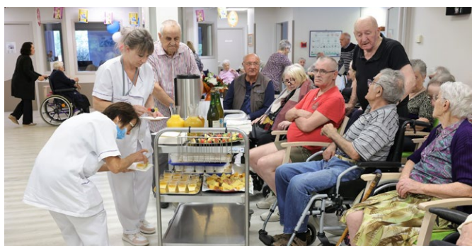
EHPAD le Pré Fleuri à Servies

Cette augmentation, unique en Occitanie, vise à couvrir les besoins spécifiques des personnes âgées en établissements (1,8 million d'euros), du secteur du handicap (2,6 millions d'euros) et de la protection de l'enfance (1,4 million d'euros).